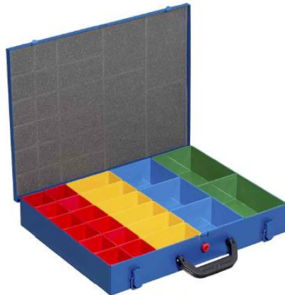
EuroPlus Pro M 44H-23