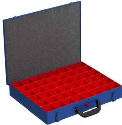
EuroPlus Pro M 44H-48