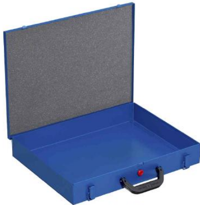
EuroPlus Pro M 44H-1