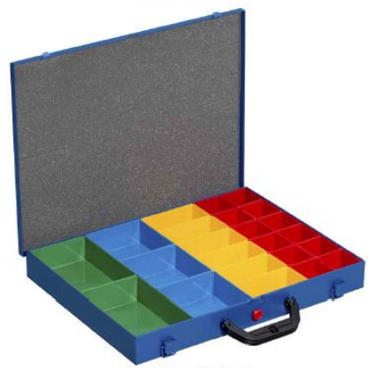
EuroPlus Pro M 44L-23