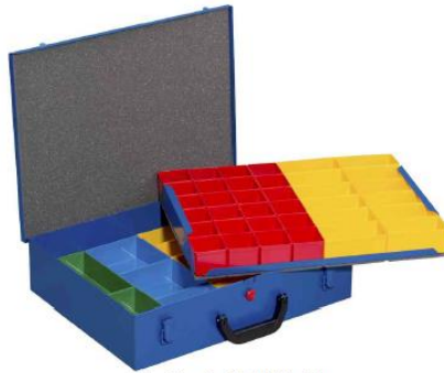
EuroPlus Pro M 44H/2L-59