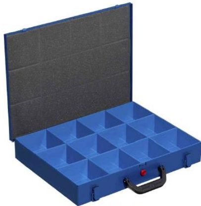
EuroPlus Pro M 44H-12