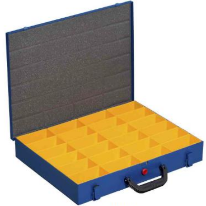
EuroPlus Pro M 44H-24