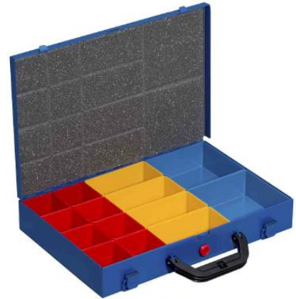
EuroPlus Pro M 34L-14