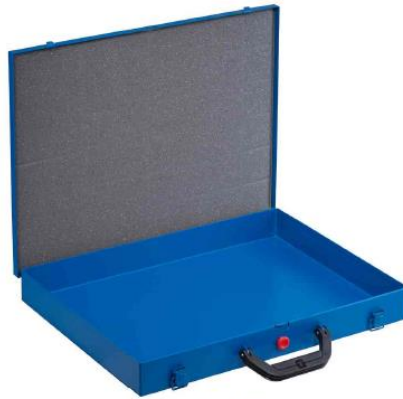
EuroPlus Pro M 44L-1